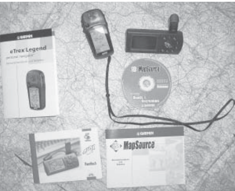
Jede Menge Zubehör: MapSource-CD mit Kartendaten und Manuals für Garmin eTrex und GPS III plus

fende Modell eMap kommt für Motorradzwecke weniger in Frage, es ist nur spritzwasserdicht. Das super fein auflösende Display vom eTrex Legend ist mit Abstand Klassenbester, das bezieht sich auf alle hier genannten Geräte. Summit hat ein ähnlich grobes Display wie GPS III plus, ist aber immer noch ausreichend: Sie bieten alle 4 Graustufen und verschiedene Menüführungen. Legend ist fast komplett mit deutschsprachiger Software und Menüführung aus-