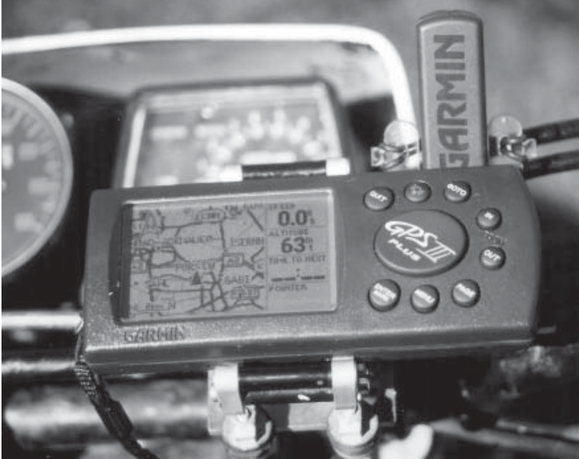
Garmin GPS III plus mit Motorradhalterung von Globetrotter: absolut wetterfest.

Die heute angebotenen Empfänger sind ausschließlich 12-Kanal Geräte. Sie können mit bis zu 12 Satelliten Kontakt aufnehmen, je mehr Signale empfangen werden, desto genauer ist folglich die Standortberechnung. 2-D Navigation ist die ungenaueste Art der Ortung, dabei reichen 2 Satelliten und eine vorher eingegebene Höhe. Werden Signale von 3 oder mehr Himmelskörpern empfangen spricht man von einer 3-D Navigation, bei der die (Meeres) Höhe relativ genauer berechnet werden kann. Einige Garmin-Geräte arbeiten zusätzlich mit einem barometrischen Höhenmesser (Summit, Vista), der bei schlechtem Empfang zu einer schnelleren Ortung verhilft. Diese Funktion ist jedoch kein Ersatz für einen guten Höhenmesser, da die Fehlerquote bei ungünstigen Empfangsverhältnissen exponentiell ansteigt. Die ermittelte Höhe des GPS-Gerätes darf man deswegen allenfalls als Zusatzinformation sehen, die einer Überprüfung bedarf. Wichtig für den Gebrauch auf dem Motorrad ist die Möglichkeit Routen am PC vorzubereiten und auf das GPS zu über-