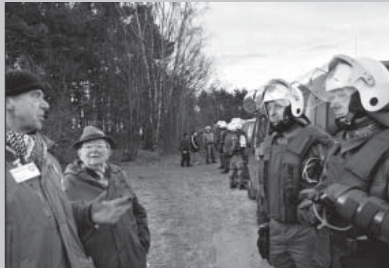
So dicht beieinander, und doch weit von einander entfernt