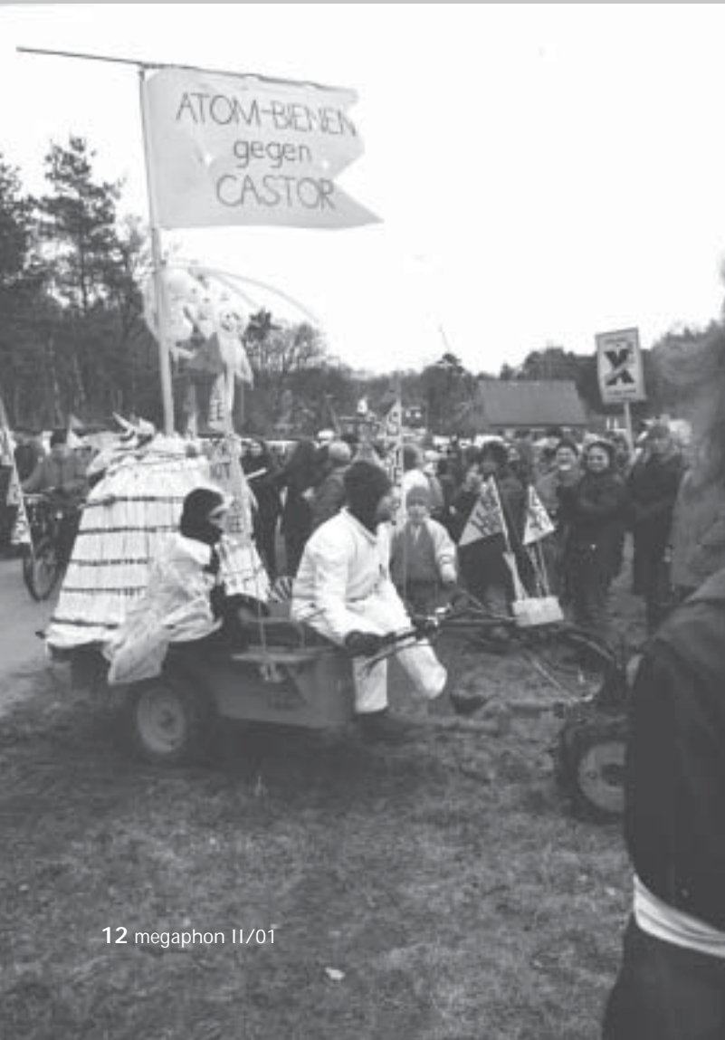
Stunk-Parade bei Seran: 500 „Trecker“ am Start