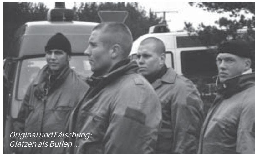
Original und Fälschung: Glatzen als Bullen ...