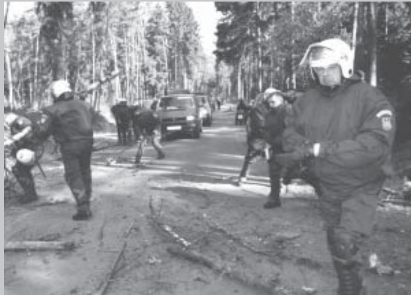
Leitstade: BGS beim „Waldputz“

nungsloses Unterfangen, mehrere ihrer Autos fuhren sie dabei auch kaputt. Einmal gelang es ihnen aber doch, und das kam so: drei von unserer Motorradgruppe hatten so viel Spaß dabei, dass sie einfach nicht aufhören wollten, obwohl die Schergen immer näher kamen. Jedenfalls mussten wir sie schließlich zurücklassen, aber kein Problem, sie hatten ein richtig gutes „Blues-Brothers-Erlebnis“. Für uns war es jedoch zu spät, die Schergen abzuhängen, wir kamen zwar noch einige Kilo-