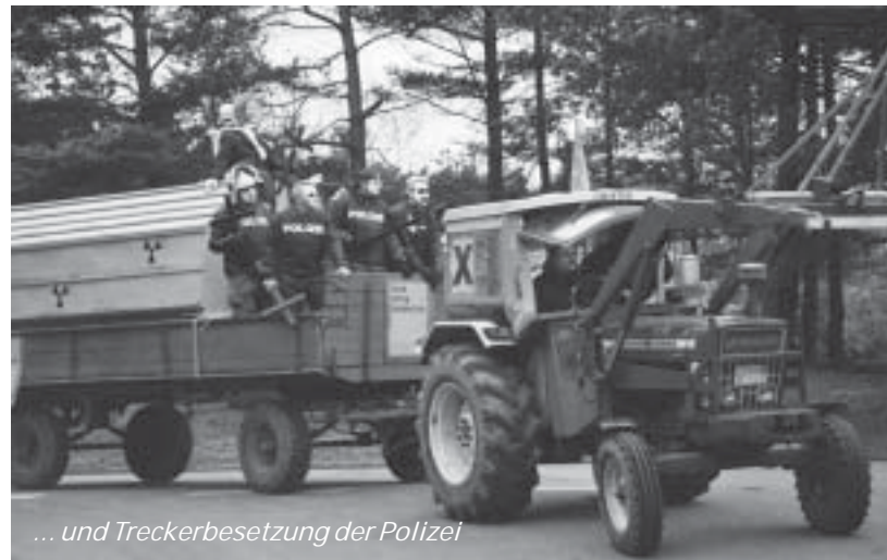
... und Treckerbesetzung der Polizei

Am nächsten Morgen brachen wir früh um 4 Uhr auf, es war klar, dass dies unser vorerst letzter Urlaubstag sein würde, und da wollten wir nichts verpassen. Wir waren zwar etwas müde, aber dann setzte ein